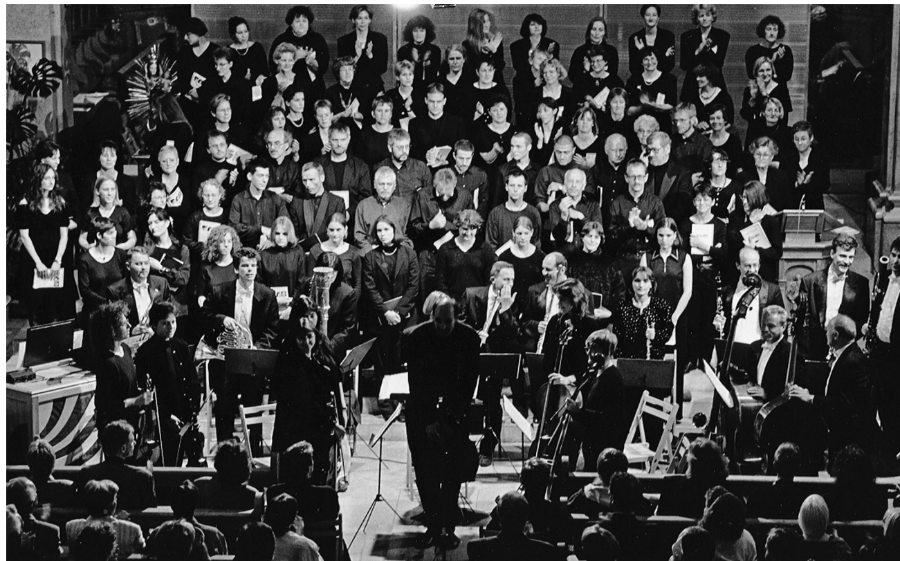
Der Chor Singkreis Wasseramt an einem seiner Konzerte.